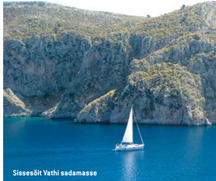
Sissesõit Vathi sadamasse