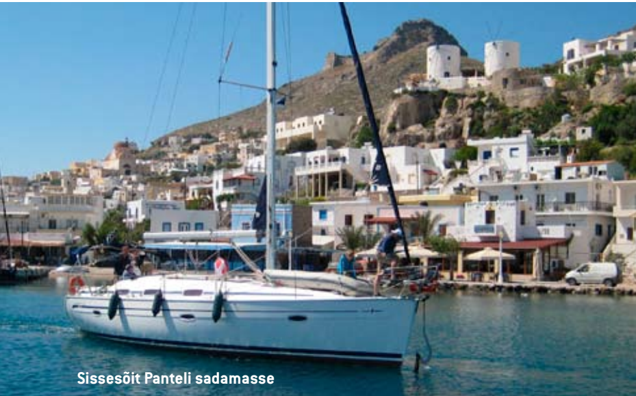
Sissesõit Panteli sadamasse