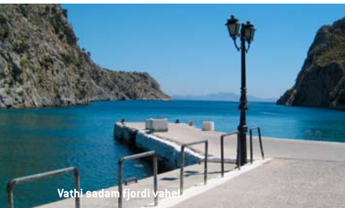
Vathi sadam fjordi vahel